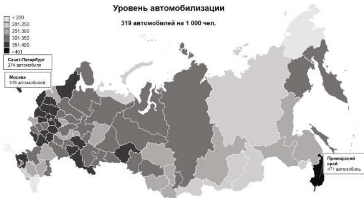
Рис. 1. Уровень автомобилизации в России в 2021 году

В среднем в России на 1 тысячу жителей приходится 319 легковых автомобилей. В 39 регионах РФ уровень автомобилизации выше среднего по стране. Самая высокая обеспеченность легковыми автомобилями в Приморском крае – 471 автомобиль на 1 тыс. жителей на 2021 год (рис. 1). [1]